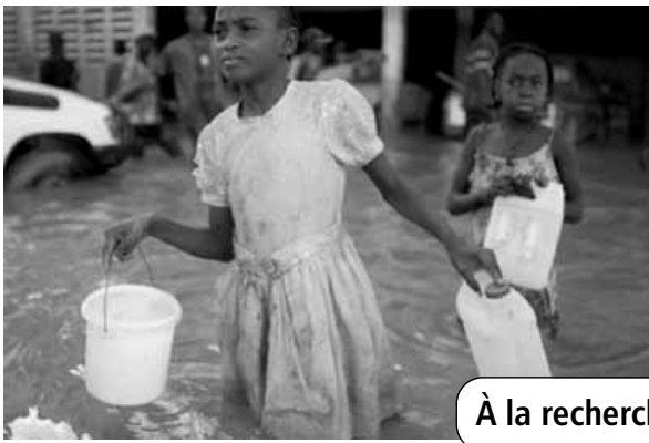
À la recherche d'eau