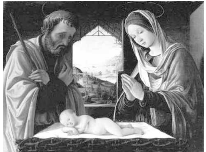
La Nativité, Lorenzo Costa, vers 1460

Se déranger, payer de sa personne, Partager ce que l'on a, Vivre simplement, Faire la vérité, Retrouver l'essentiel, C'est vivre une vie nouvelle!