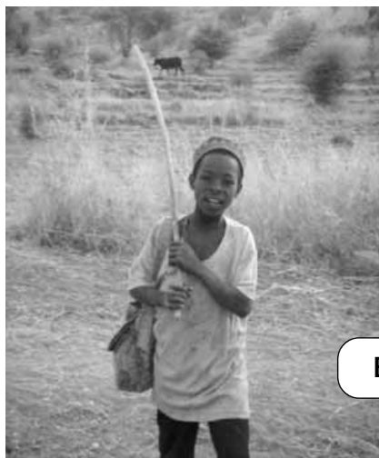
Enfant de Tourou

Tourou est un village du canton de Mokolo qui s'étend sur vingt kilomètres de long. Le village est montagneux, coupé par une vallée profonde, ce qui rend les déplacements difficiles. Cette région est marquée par un grand retard en ce qui concerne la santé et la formation dans tous les domaines. Deux ethnies se partagent ce territoire : les Mafas avec 55 000 habitants et les Hides avec 45 000 habitants. Il n'y a pas de culture industrielle possible, car le sol est pauvre et les revenus sont presque nuls. Nous travaillons dans la Mission catholique de Tourou où les parents se débattent pour l'éducation de leurs enfants.