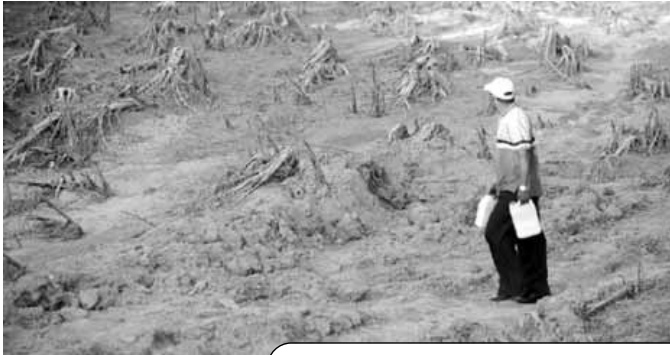
Ce qu'il reste d'une bananeraie