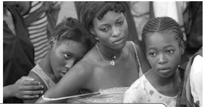
En attente dans un centre de distribution de nourriture après les quatre ouragans