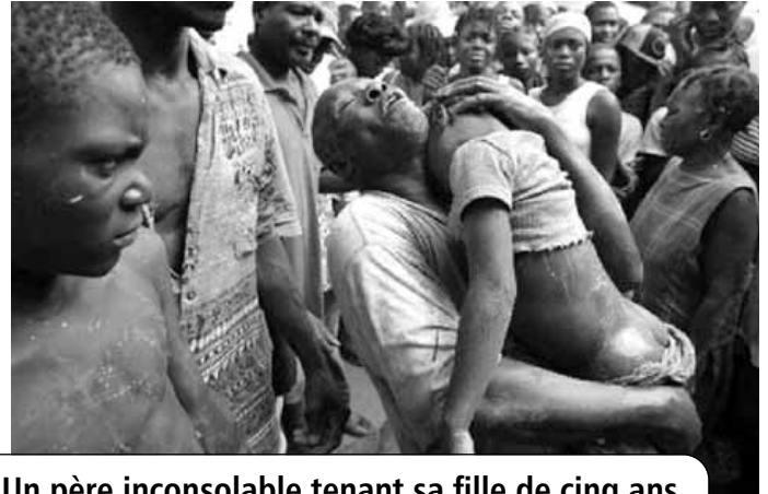
Un père inconsolable tenant sa fille de cinq ans morte dans l'inondation causée par Ike

⇒ Quelque 800 morts, 300 disparus et 550 blessés