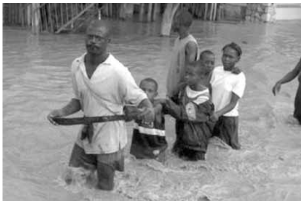
Famille fuyant les inondations

⇒ Quelque 800 morts, 300 disparus et 550 blessés