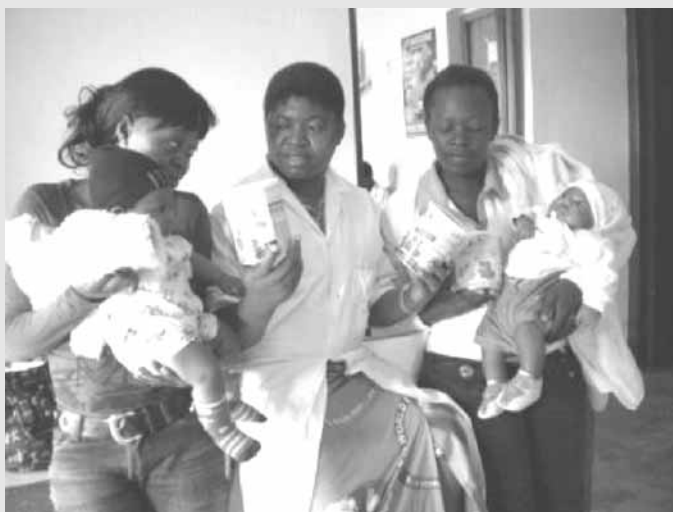
S. Eugénie et 2 mères séropositives avec leur enfant au dispensaire de Mbalmayo

L'aide reçue de Secours Tiers-Monde nous a permis de réduire le taux de transmission du VIH/SIDA des mères séropositives à leurs bébés grâce à une alimentation au lait artificiel et aux soins adéquats. Maintenant, nous pouvons faire tester les bébés à partir de la 6 e semaine de vie. Ceci nous permet de connaître la sérologie plus tôt que les années antérieures et d'entreprendre une prise en charge mieux adaptée. Au cours de l'année écoulée, nous avons pu tester 29 enfants nés de mères séropositives et 27 d'entre eux ont une sérologie VIH négative. La majorité des nos jumeaux et triplés a pu également échapper à la malnutrition grâce au supplément en lait artificiel offert, au dispensaire, par la subvention reçue.