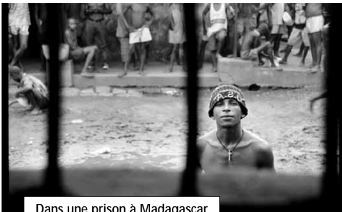
Dans une prison à Madagascar

La prison « Maison d'Arrêt » est située dans la petite ville d'Ambatolampy (40 000 habitants), à 70 km au sud d'Antananarivo. Au dernier recensement, il y avait environ 300 prisonniers, hommes et femmes.