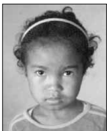
Solemita 6 ans, 2 e année Madagascar