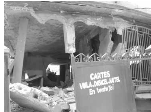
et une boutique de cartes