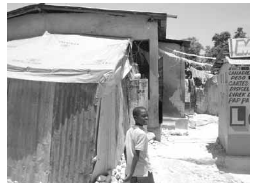
Abri de toile « temporaire »