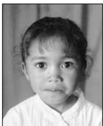
Mendrika 6 ans, 2 e année Madagascar