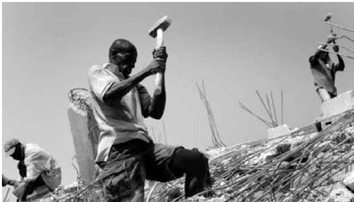
En haut : démolition « à bras » En bas : abri de fortune

La Croix-Rouge, qui dressait récemment un portrait sombre de la situation sur le terrain, se donne quatre priorités: les abris, les soins médicaux, l'accès à l'eau et la préparation aux ouragans.