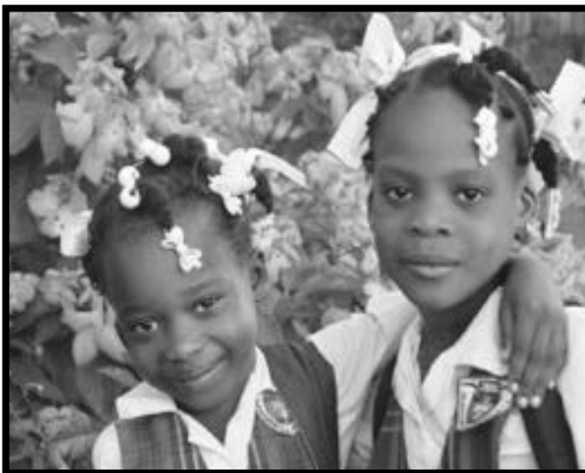
HAÏTI : De joyeux étudiants de l'Institut Jean-Paul II de Ouanaminthe.